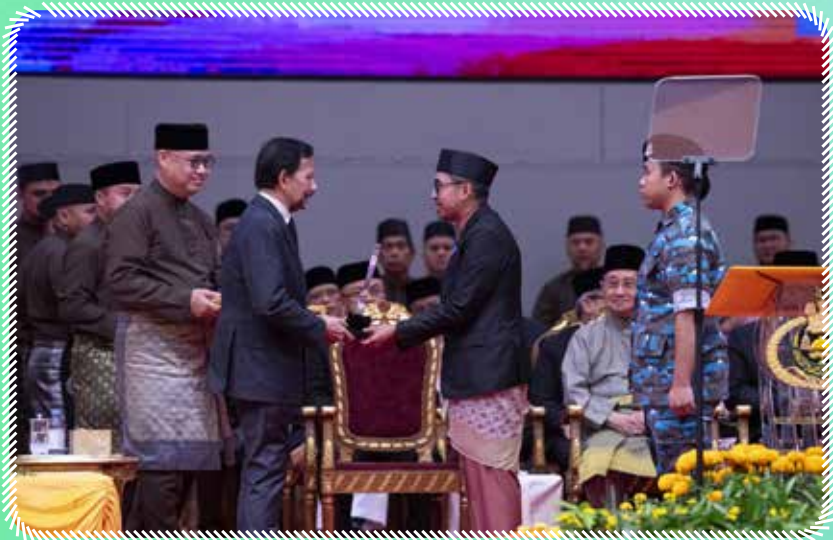
Penerima Projek Cemerlang Untuk Belia Seacage Fish Farming (Fatih Aquaculture) and Child Care Centre (Alya Playhouse)