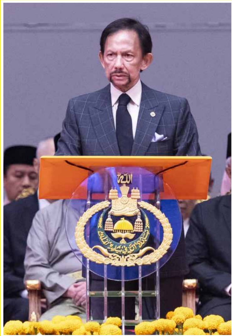
Kebawah Duli Yang Maha Mulia Paduka Seri Baginda Sultan Haji Hassanal Bolkiah Mu'izzaddin Waddaulah ibni Al-Marhum Sultan Haji Omar 'Ali Saifuddien Sa'adul Khairi Waddien, Sultan dan Yang Di-Pertuan Negara Brunei Darussalam berkenan mengurniakan titah pada Sambutan Hari Belia Kebangsaan Ke-18, Tahun 2023 di Pusat Persidangan Antarabangsa pada 1 Ogos 2023.