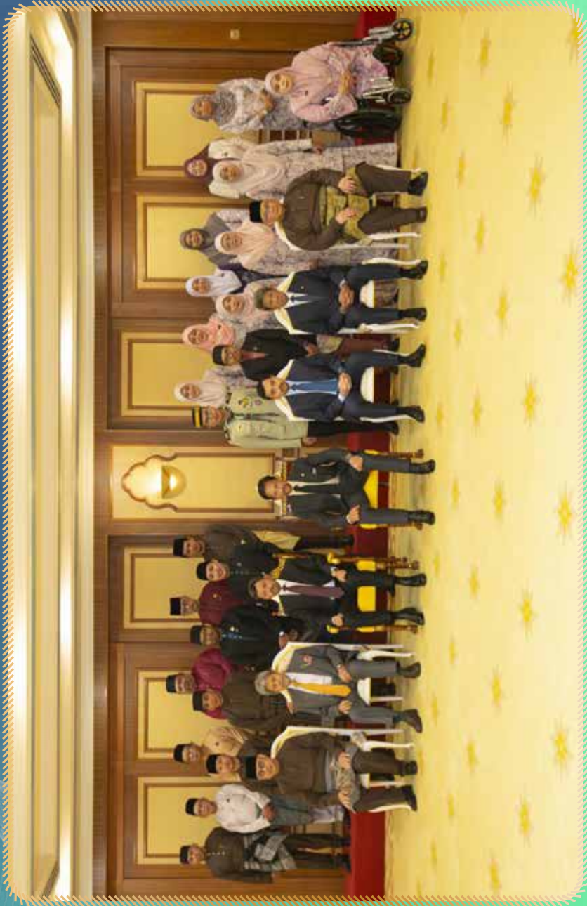
Kebawah Duli Yang Maha Mulia Paduka Seri Baginda Sultan Haji Hassan Bolkiah Mur'izzaddin Waddaulah, Sultan dan Yang Di-Pertuan Negara Brunei Darussalam dan Kerabat Diraja bersama Penerima-penerima Anugerah Belta Kebangsaan Ke-18, Tahun 2023.