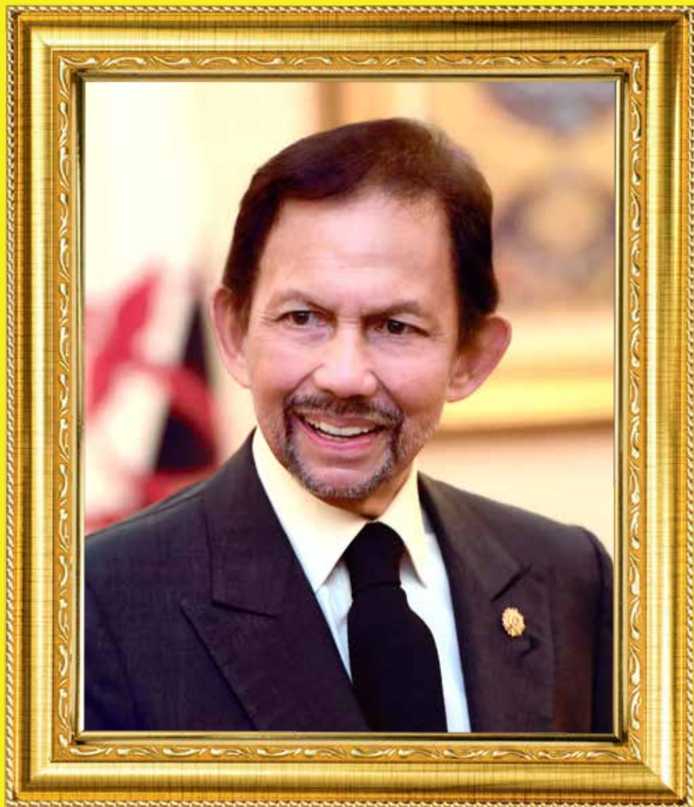
Kebawah Duli Yang Maha Mulia Paduka Seri Baginda Sultan Haji Hassanal Bolkiah Mu'izzaddin Waddaulah ibni Al-Marhum Sultan Haji Omar 'Ali Saifuddien Sa'adul Khairi Waddien, Sultan dan Yang Di-Pertuan Negara Brunei Darussalam